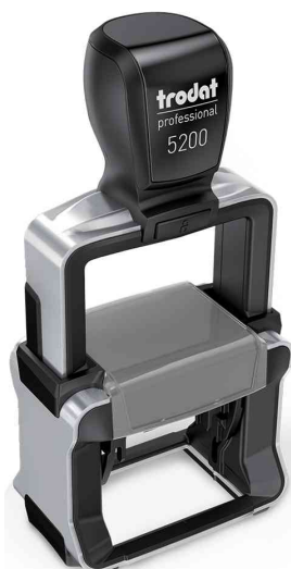
Tampon pour texte Professional 5200

Info: nous livrons tous les tampons configurables à domicile à partir d'une commande d'une pièce! S'il vous plaît, tenez compte du fait que les tampons configurables sont toujours traités dans une commande séparée!