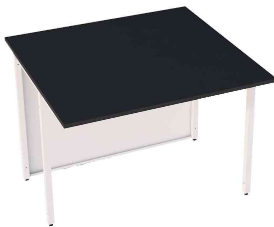
Table annexe pour comptoir Cento