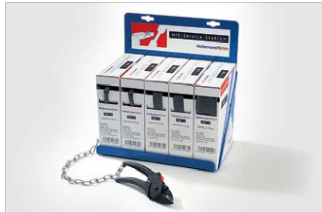
HIS-Service Station, 5 dispenserboxen en een speciale schaar.