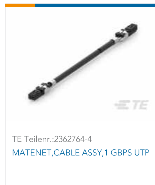
TE Teilnr.:2362764-4 MATENET,CABLE ASSY,1 GBPS UTP