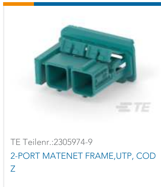
TE Teilnr.:2305974-9 2-PORT MATENET FRAME,UTP, COD Z