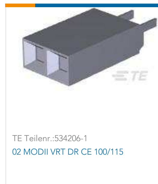
TE Teilnr.:534206-1 02 MODII VRT DR CE 100/115