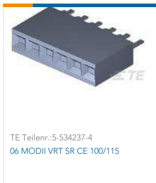
TE Teilnr.:5-534237-4 06 MODII VRT SR CE 100/115