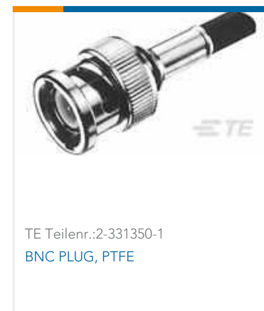
TE Teilnr.:2-331350-1 BNC PLUG, PTFE