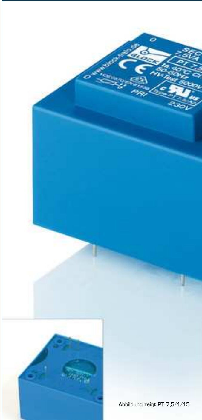
Abbildung zeigt PT 7,5/1/15