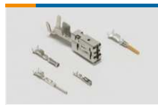
Kontakte für Pkw, Lkw, Busse und Off-Road-Fahrzeuge(16)