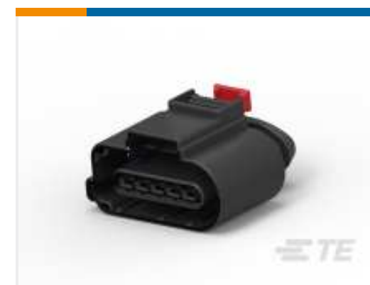
TE Teilenummer CAT-AM705-CH8172 AMP MCP, ABGEDICHTETES STECKVERBINDERGEHÄUSE

Auch serienmäßig | AMP Superseal 1.5mm Series