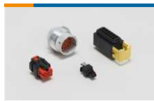
Gehäuse für Pkw, Lkw, Busse und Off-Road-Fahrzeuge(26)