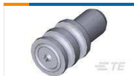
TE Teilenummer963531-1 BLINDSTOPFEN