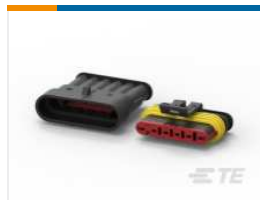
TE Teilenummer CAT-AM71-CH8172 AMP SUPERSEAL 1.5MM, STECKVERBINDERGEHÄUSE