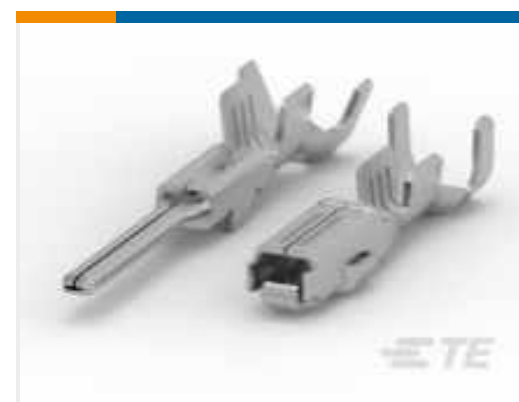
TE Teilenummer CAT-AM71-T273 AMP SUPERSEAL 1.5MM, BUCHSE UND FLACHSTECKER