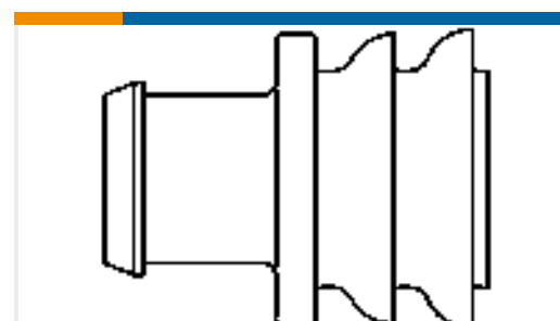
TE Teilenummer281934-3 SINGLE WIRE SEAL