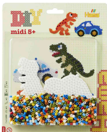
Perles à repasser midi "voiture/dinosaure", sous blister

ATTENTION : ne convient pas aux enfants de moins de 36 mois en raison des petites pièces qui peuvent être avalées.