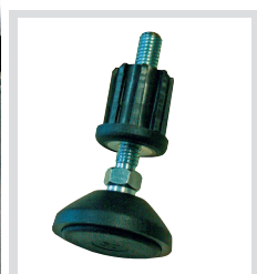
Höhenverstellbare Fußplatte als Sicherheitszubehör erhältlich

i Die Alu-Gitterroststufen erfüllen die höchste Anforderung an die Rutschhemmung – Bewertungsgruppe R 13 gemäß BGR 181