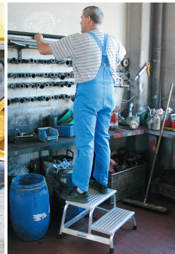
MontageTritt mit Zubehör: 805133