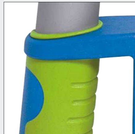
Leichtes, hochfestes Aluminiumrohr, 2K-Griffe mit Klemmschutz