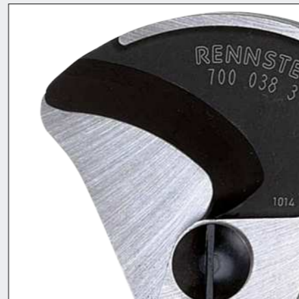
Optimierte Schneidengeometrie mit Präzisionsschliff, nachstellbares Schraubgelenk, vergüteter Spezialstahl