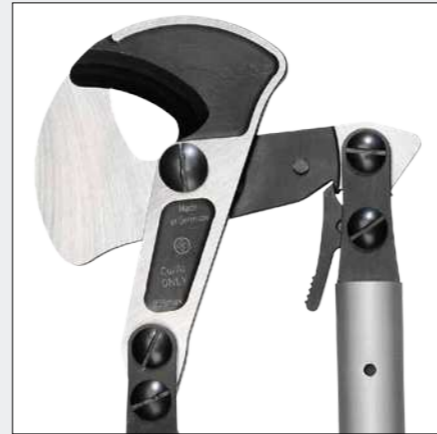
Optimaler Krafteinsatz durch Knickarmmechanik