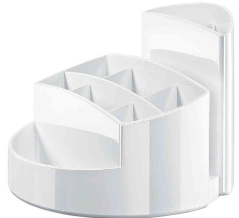
Multiköcher RONDO, weiß