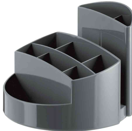
Multiköcher RONDO, dunkelgrau