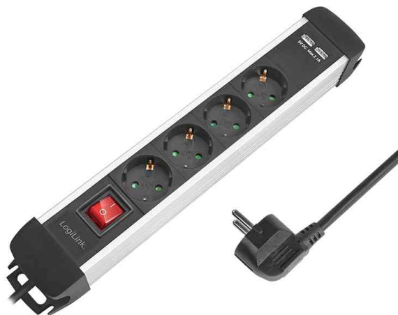
Überspannungsschutz-Steckdosenleiste, 4-fach und 2 x USB - mit Schalter