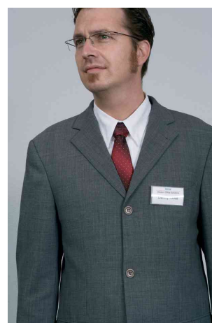
Badge Click Fold, exemple d'utilisation