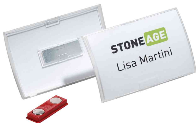
Visuel de référence: Badge Click Fold, avec aimant