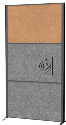
Surface: acoustique gris foncé / liège (9605089)