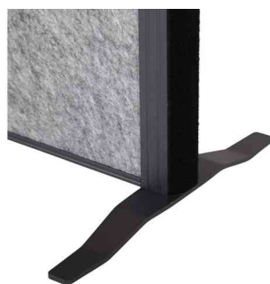
Vue détaillée: pied