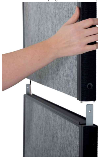
Vue détaillée: modules enfichables