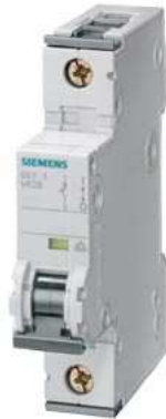
Leitungsschutzschalter 230/400V 10kA, 1-polig, C, 2A, T=70mm