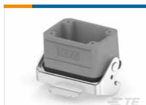
TE Teilnr.:T1730060000-000 H6B-TBF-T