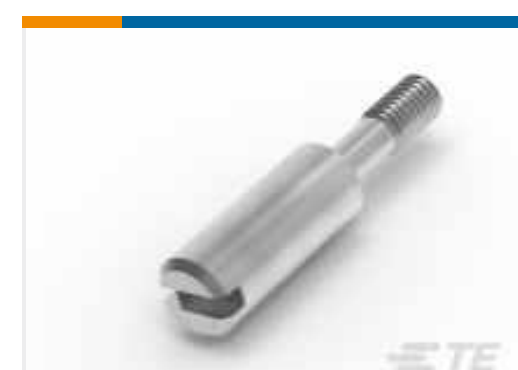
TE Teilnr.:T0931003003-000 CODING-PIN-M3