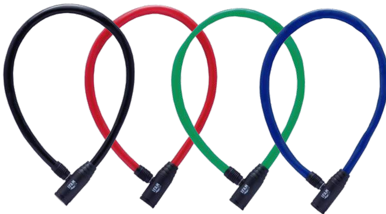
JUNIOR 50 / JUNIOR 60