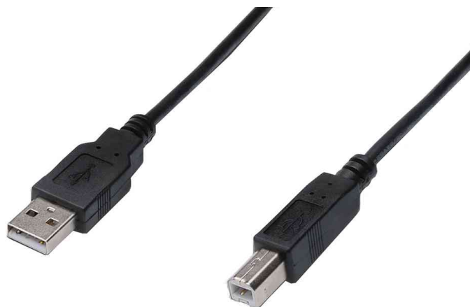
USB 2.0 Anschlusskabel, USB-A Stecker - USB-B Stecker