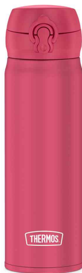
Isolier-Trinkflasche Ultralight, pink