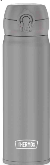
Isolier-Trinkflasche Ultralight, grau