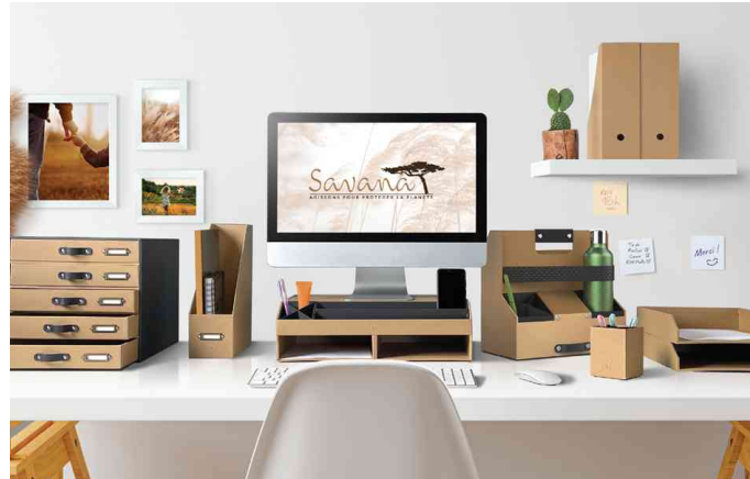
Visuel de référence : montre la série "Savana"