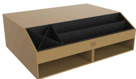
Support pour écran "Savana"