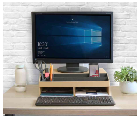
Visuel de référence : montre le produit en utilisation (130 mm)