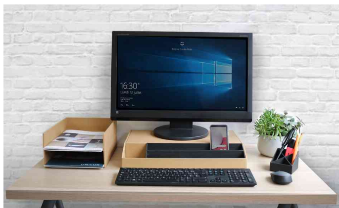
Visuel de référence : montre le produit en utilisation (80 mm)