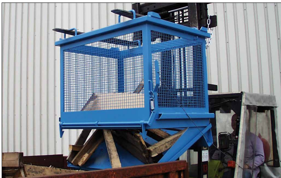
Typ SB-G 1000