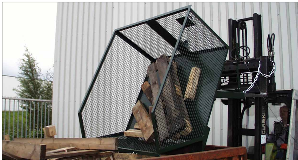
Typ GU-G 1000

Gitterbehälter für leichte Güter, wie z.B. Papier, Kunststoffe, Holz, Grünabfälle