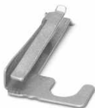
Abfalleitblech 2, für CF CRIMPHANDY 1,5

https://www.phoenixcontact.com/de/produkte/1212844