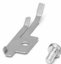
Abfalleitblech 1, für CF CRIMPHANDY 0,5 /0,75 /1,0/1,5

https://www.phoenixcontact.com/de/produkte/1212514