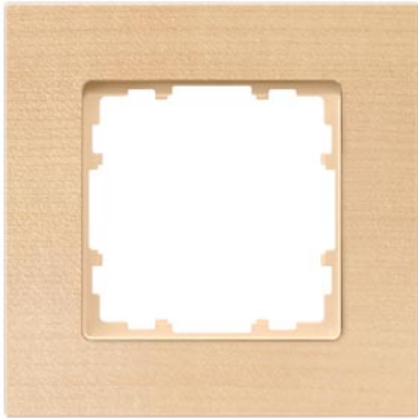
DELTA miro Holz buche Rahmen 1-fach 90x90mm