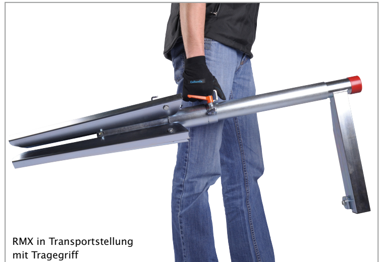
RMX in Transportstellung mit Tragegriff