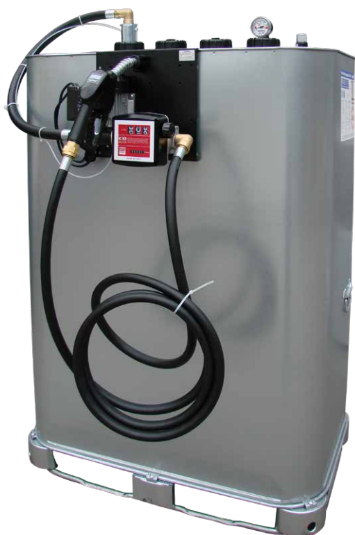
Kleintankanlage E 56-BS/Z

zur Befestigung von Pumpe und Schlauchhaspel auf dem Tank; kann auf alle gängigen Tankmodelle montiert werden.