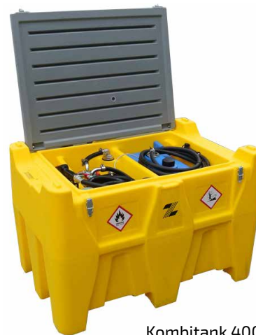
Kombitank 400 / 50