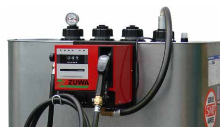
Kleintankanlage KT 50