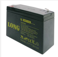
dryfit-Akku 6 V / 7 Ah

Quecksilber-/Cadmiumfrei hochbelastbar, Long-Life Verpackungseinheit (VPE): 24 Stück