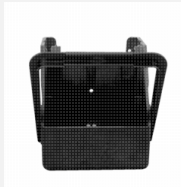
Transportlader für Euro-Blitz

Volt: 6 Amperestunden: 7 geeignet für: Euro-Blitz, Euro-Synchron, TRI-Blitz