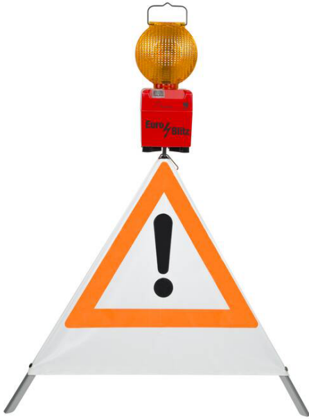
Anwendungsbeispiel mit Faltsignal