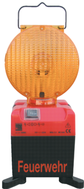
Modellbeispiel mit Sonderaufdruck Feuerwehr