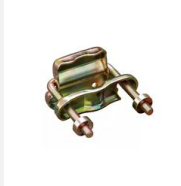
Secura-Schloss 52 mm, zur Montage von Warnleuchten an Pfosten und Rohren, VPE 10 Stk.