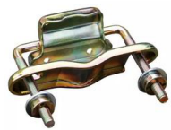
Secura-Schloss 82 mm zur Montage von Warnleuchten an Pfosten oder Rohren, VPE 10 Stk.