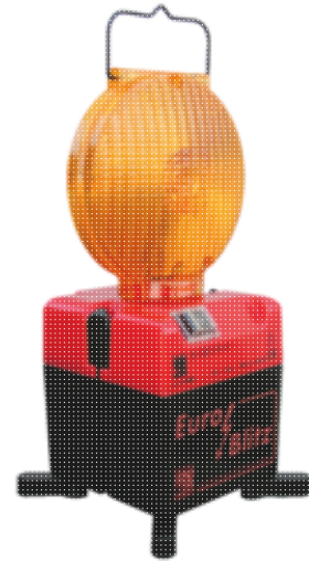
Modellbeispiel: Blitzleuchte -Euro-Blitz- ein-/zweiseitig, Batterie- oder Akkubetrieb (Art. 18486)