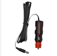
Ladekabel mit Stecker für Bordnetz 12 V / 24 V