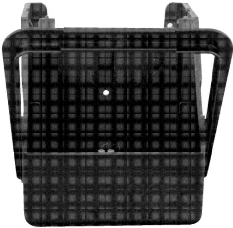
Modellbeispiel: Transportlader (Art. 20975)