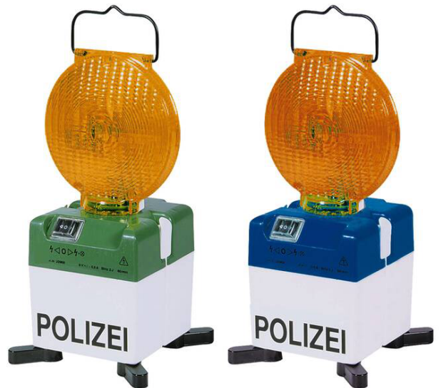
Modellbeispiele: Sonderdrucke Polizei nur auf Anfrage erhältlich (nur Polizeidirektionen)