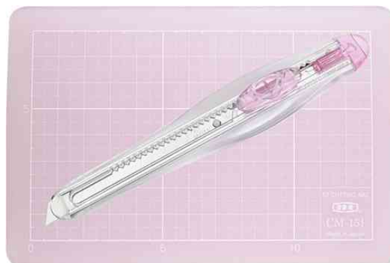
Kit cutter et tapis de découpe AM350P, rose