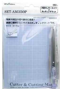
Visuel de référence : emballage