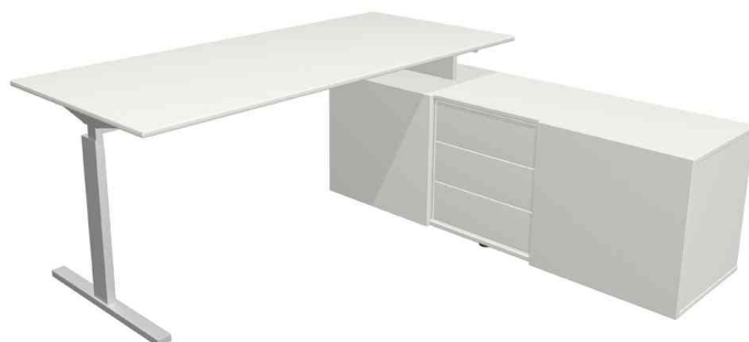
Bureau complet "Form 2", blanc