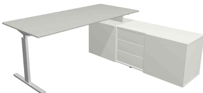
Bureau complet "Form 2", gris clair