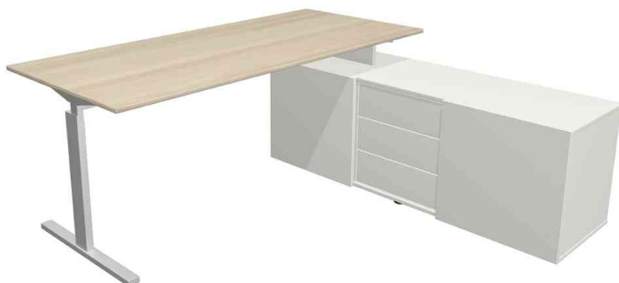
Bureau complet "Form 2", chêne