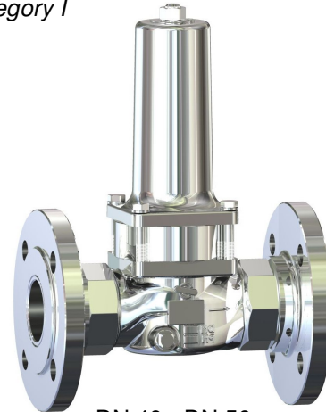
DN 40 - DN 50