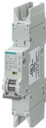
LEITUNGSSCHUTZSCHALTER 10KA, 1-POLIG, C, 0.3A NACH UL 489 - 277V