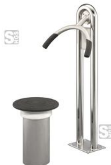
Modellbeispiel: Hüfttrainer -Workout-, Einzelstation (Art. 28176)

Anwendungsbereiche: Vereins-, Wohn-, Park-, Freizeit- und Sportanlagen, Firmen, Fußgängerzonen, Einkaufszentren, Hotels, Campingplätze, Kliniken, Wohngebiete etc.