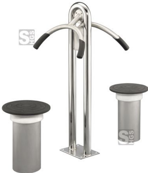
Modellbeispiel: Hüfttrainer Doppelstation (Art. 28177)