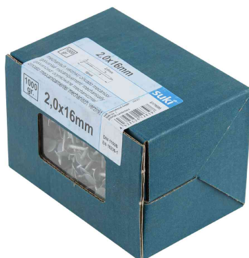
Visuel de référence: pointe pour carton bitumé, dans un carton