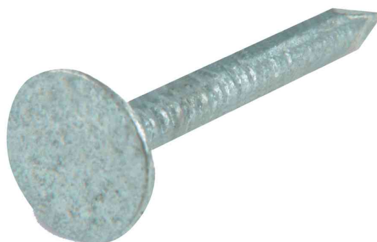
Visuel de référence: pointe pour carton bitumé