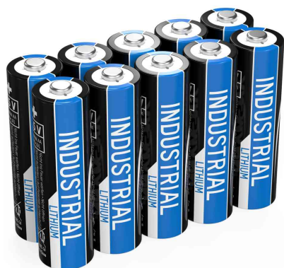
Pile au lithium "Industrial", Mignon AA