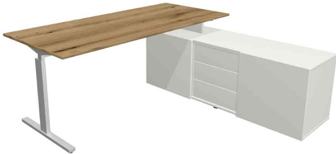
Komplett-Arbeitsplatz "Form 2", ahorn

Die Lieferung erfolgt zerlegt - Montageservice auf Anfrage!