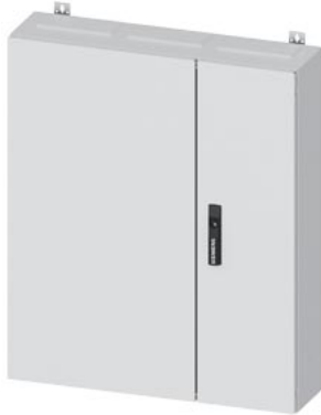
ALPHA 400 DIN Wandverteiler Aufputz H=950mm, B=800mm, T=210mm IP55, Schutzklasse I RAL 9016