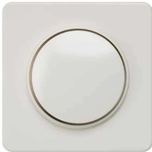
DELTA PROFIL, TITANWEISS ABDECKPLATTE FUER DIMMER MIT DREHKNOPF 65X65MM