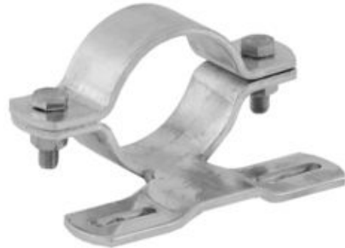
Modellbeispiel: Rohrschelle aus Aluminium für Flach-VZ (Art. rar107)