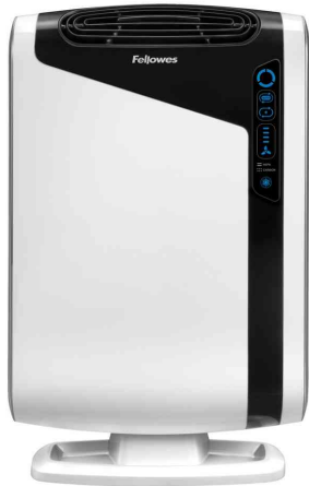
Luftreiniger AreaMax DX95