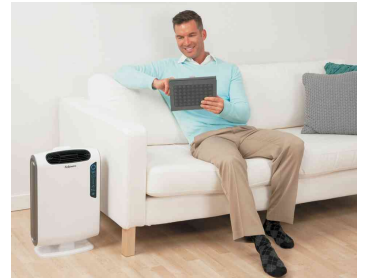
Luftreiniger AreaMax DX95, Anwendung