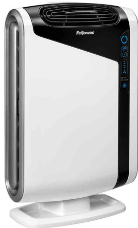
Luftreiniger AreaMax DX95