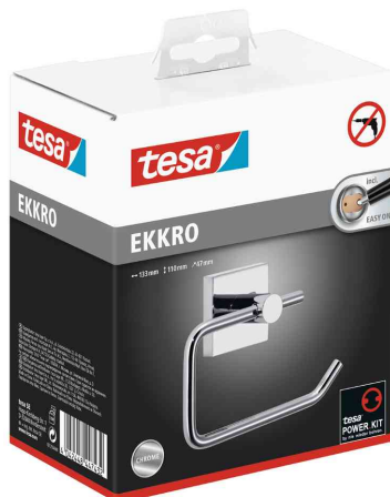
WC-Papierrollenhalter EKKRO, Verpackung

Weitere Artikel der Serie EKKRO finden Sie über die Stichwortsuche im WebShop!