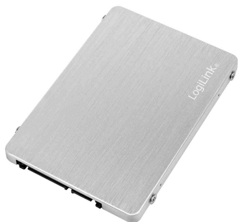
2,5" Externes SSD-Gehäuse für M.2 NGFF SATA