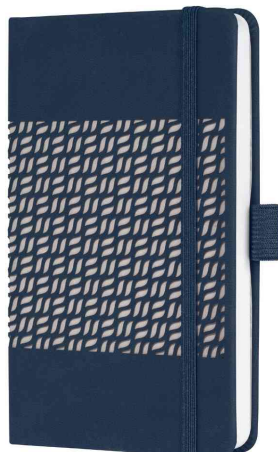
Agenda planning Jolie Impress "Midnight Blue"