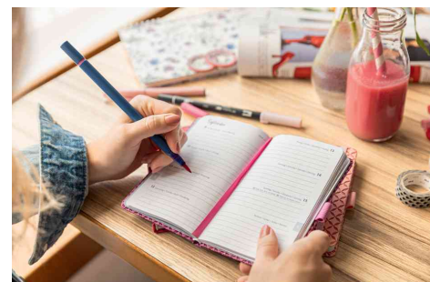
Visuel de référence : montre le produit en utilisation