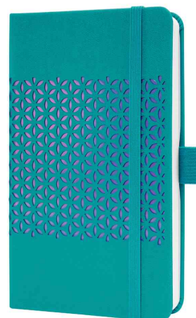
Agenda planning Jolie Impress "Shimmering Seas"