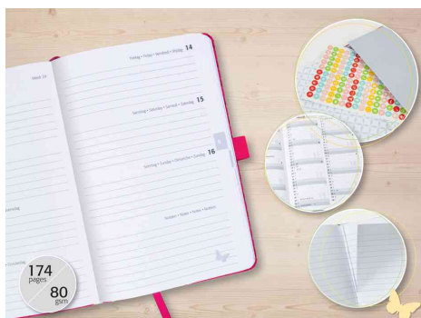
Visuel de référence : montre l'intérieur