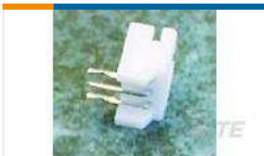
TE Teilnr.:1-440055-1 2.0MM,HDR,11POS,R/A