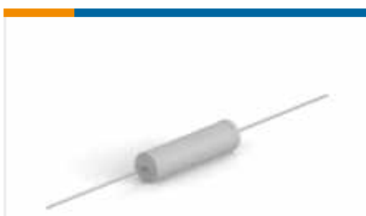
TE Teilnr.:4-2176414-8 7W STD M/OX 5% 1K8