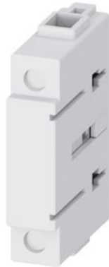
N-Durchgangsklemme, Fronteinbau, Zubehör für Lasttrennschalter 3LD3