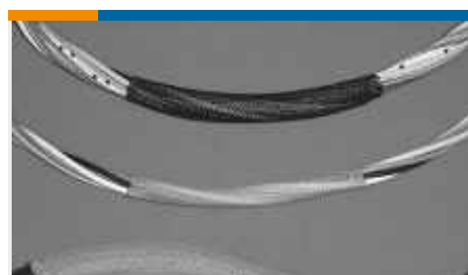
TE Teilnr.:D992244001 VERSAFLEX-06-0-SP