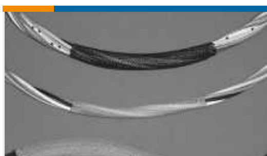
TE Teilnr.:D288374001 VERSAFLEX-20-0-SP