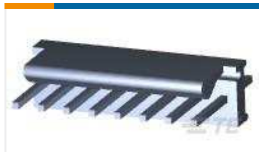
TE Teilnr.:640456-8 08P MTA100 HDR ASSY F/L SQ STR