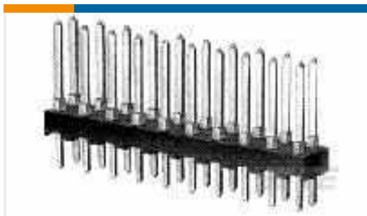
TE Teilnr.:87227-5 10 MODII HDR DRST UNSHRD .100