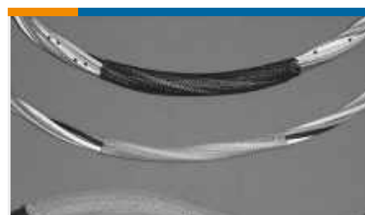
TE Teilnr.:C060084001 VERSAFLEX-10-0-SP