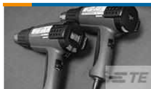
TE Teilnr.: CJ2087-000 HL2010E-KIT-120V