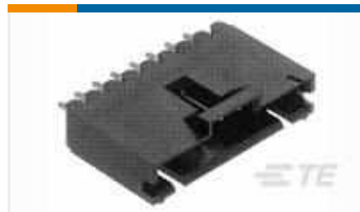
TE Teilnr.:5-103735-1 02 MTE HDR SRST LATCH .100CL