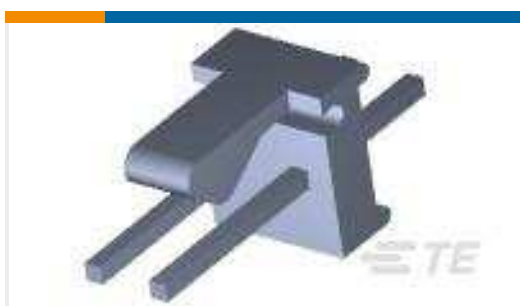
TE Teilnr.:640456-2 02P MTA100 HDR ASSY F/L SQ STR