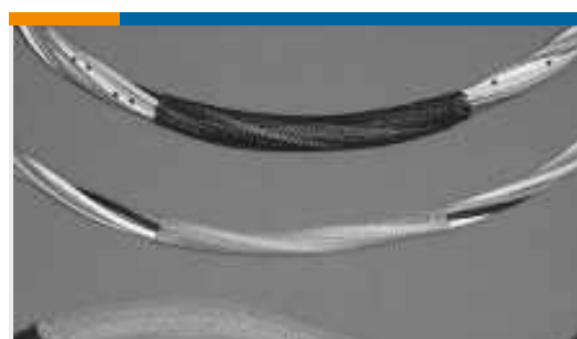
TE Teilnr.:A584924001 VERSAFLEX-05-0-SP