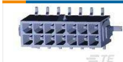
TE Teilenummer4-794637-4 14P MICRO MNL ASSY,VRT,SMT LF