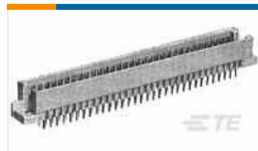
TE Teilenummer650919-5 120 EURO TYPE R PIN ST ASSY