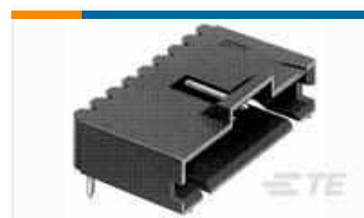
TE Teilenummer 5-103635-6 07 MTE HDR SRRA LTCH.100CL LF