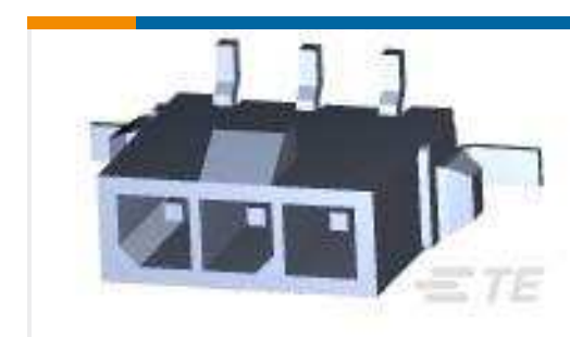
TE Teilenummer 2-1445087-3 MICRO MNL HDR ASSY S/ROW AU LF