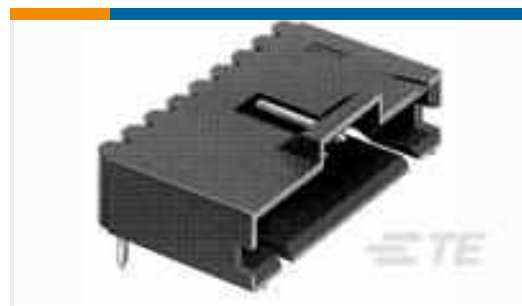
TE Teilenummer5-103635-7 08 MTE HDR SRRA LTCH.100CL LF