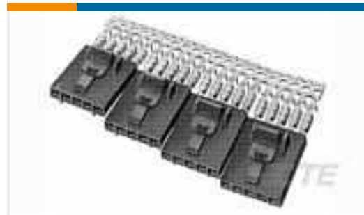
TE Teilenummer 5-103957-8 2X9 MTE RCPT SR LATCH .100CL