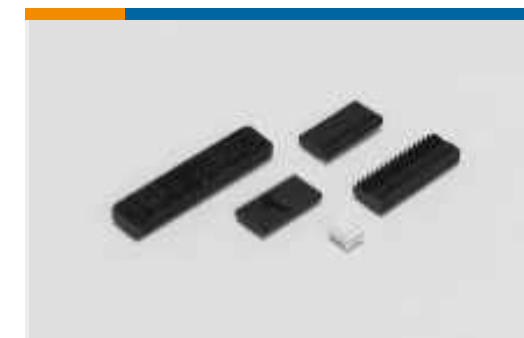
Kabel-an-Leiterplatte- Steckverbindersätze und -gehäuse(589)