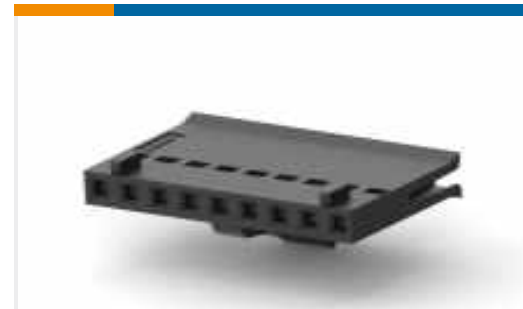
TE Teilenummer 487526-8 009 HOUSING FFC RCPT 100CL SR