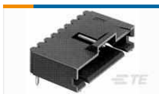
TE Teilenummer 6-103635-4 15 MTE HDR SRRA LTCH.100CL LF