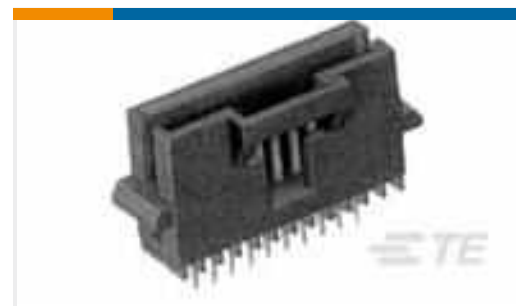
TE Teilenummer6-104071-7 40 SYSTEM 50 HDR SRST SHRD SN