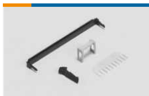
Zubehör für Bändchenkabel- Steckverbinder(1)