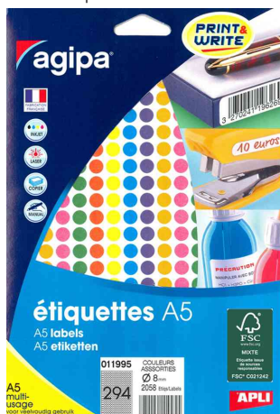
Pastilles de couleur, diamètre: 8 mm