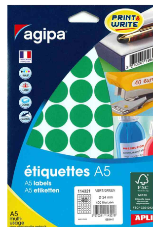
Pastilles de couleur, diamètre: 24 mm