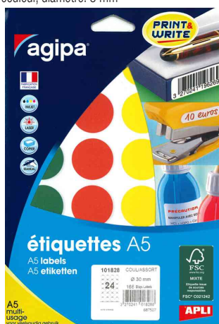
Pastilles de couleur, diamètre: 30 mm