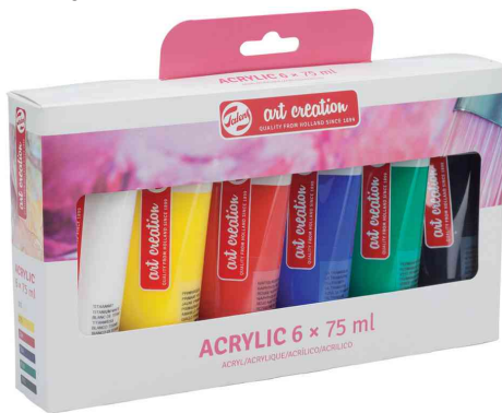
Acrylfarbe ArtCreations Essentials, 6er-Set