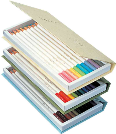
Buntstifte "IROJITEN" Rainforest - offen