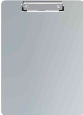
Klemmbrett, Aluminium mit Magnetband und Bügelklemme