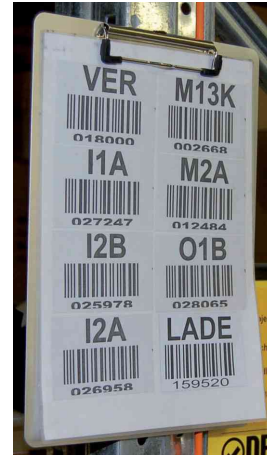
Klemmbrett, Aluminium mit Magnetband und Bügelklemme, Anwendungsbeispiel