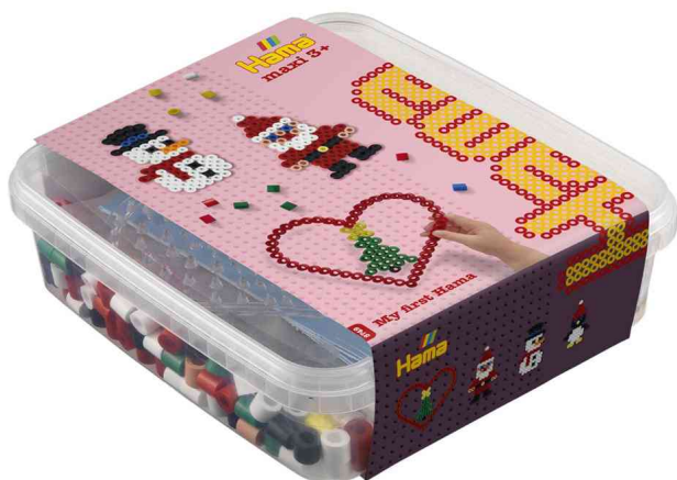
Bügelperlen maxi + Stiftplatte "Weihnachten", in Box

ACHTUNG! Nicht geeignet für Kinder unter 36 Monaten, wegen verschluckbarer Kleinteile.