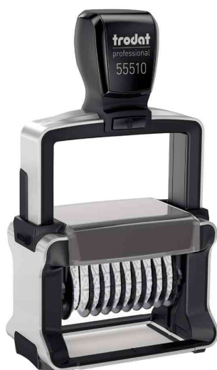
Zifferstempel Professional 4.0 55510

explications: couleur = couleur de l'empreinte